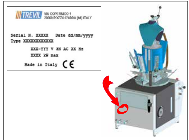
Figura 2.1 - Posición de la etiqueta